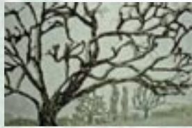
Gudrun Borek, Tyskland